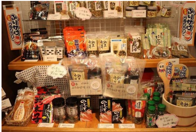
クラッシーノこうし 様