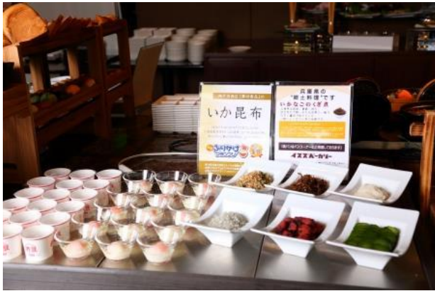
神戸三宮東急REIホテル様 朝食バイキング