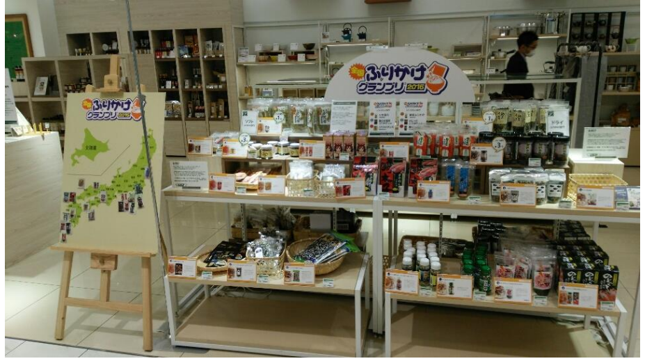
東急ハンズ博多店様