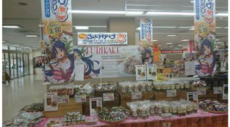
マルシヨクサンリブくまなん店様