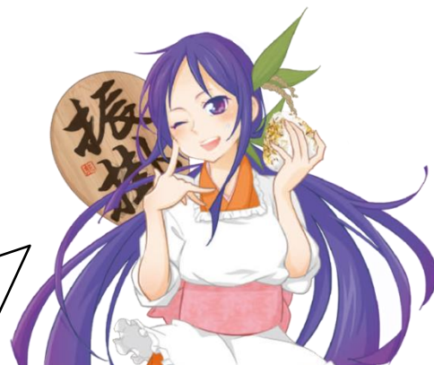
ふりかけイメージキャラクター 振華(ふりか)ちゃん