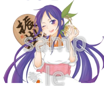
イメージキャラクター振華(ふりか)ちゃん