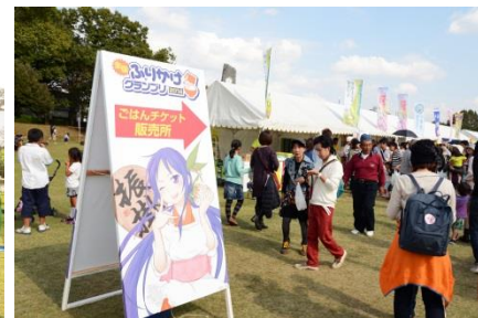
全国ふりかけグランプリ®の模様