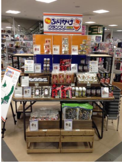
東急ハンズ姫路店様

現在、東急ハンズやスーパー等で、ふりかけグランプリのコーナーでの催事が行われており、関西のホテルの朝食でも、グランプリを受賞したふりかけが置かれています。